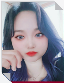
뷰티아트과 18학번 정○○

학교 다니면서 배운 지식, 기술, 태도를 통해 현장에서 직무를 바로 수행할 수 있어 좋았어요. 교수님들도 모두 친절하시고 전문적으로 지도해주셔서 너무 감사했어요.