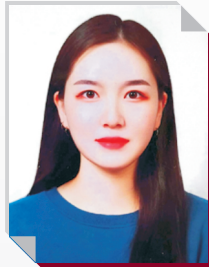
태권도융합과 20학번 전○○

태권도융합에 필요한 과목들을 주로 수업을 병행하며 주말을 통하여 태권도승품/단 심사진행위원, 경호실습(콘서트) 기업의 요청에 따라 현장실습을 미리 경험하며, 무도실력과 안무, 음악을 같이 배울수 있다는 점이 태권도융합과의 가장 큰 장점이라고 생각합니다. 그리고 교수님들께서 적극적으로 학생들 하나하나 관리해주면서 부족한 부분을 바로 피드백을 받을 수 있다는 점이 장점입니다. 또한 태권도의 역사부터 태권도가 발전해온 계기들과 태권도전공자의 역할들을 배우고 교수님께서 중요하다고 강조하시는 부분들과 여러가지 조언들이 저에게 큰 도움이 되며 향후 꿈은 교육자 목표로 4년 학사과정을 마치고 나면 대학원에 학업을 진행하며 기업체 보안분야로 취업할 예정입니다.